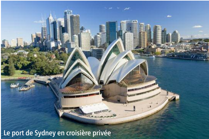
Le port de Sydney en croisière privée