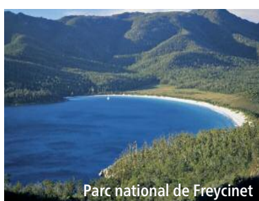
Parc national de Freycinet