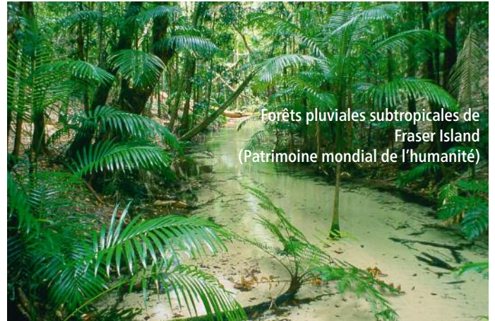
Forêts pluviales subtropicales de Fraser Island (Patrimoine mondial de l'humanité)