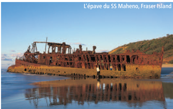
L'épave du SS Maheno, Fraser Island