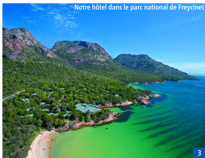
Notre hôtel dans le parc national de Freycinet