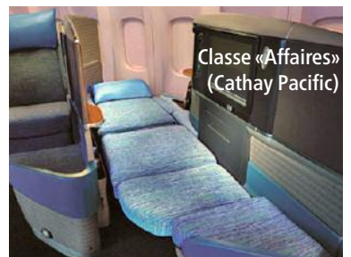
Classe «Affaires» (Cathay Pacific)