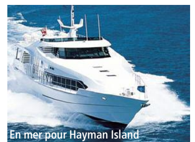
En mer pour Hayman Island