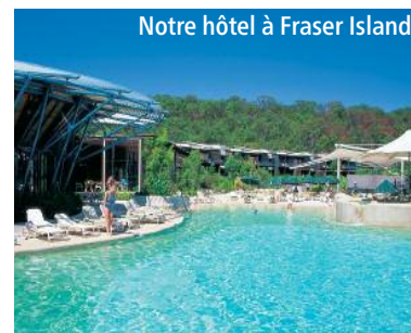
Notre hôtel à Fraser Island

Bien choisis, quelques moments appréciés de temps libre sont répartis par ci et par là. Au bord de l'océan, dans une nature extraordinaire ou en ville, ils vous permettront de vous détendre, de vous promener, de vous baigner, de faire quelques achats, de profiter d'un centre de soins corporels, d'écrire ou de prendre des photos.