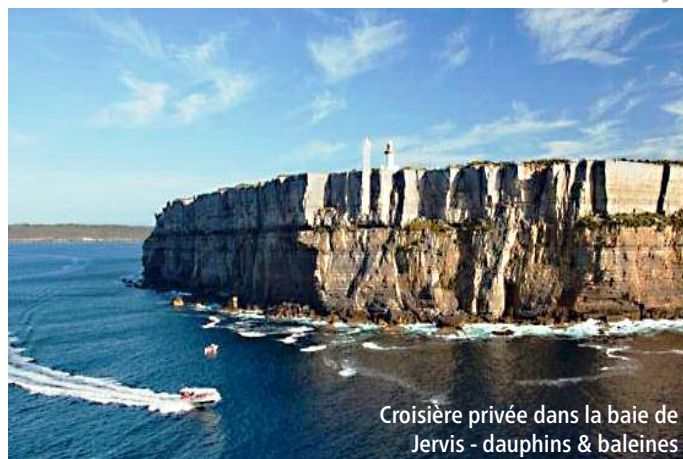
Croisière privée dans la baie de Jervis - dauphins & baleines