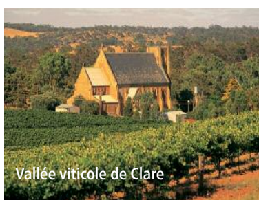
Vallée viticole de Clare