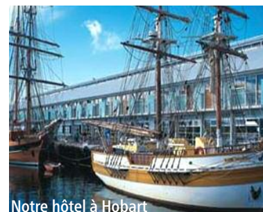
Notre hôtel à Hobart