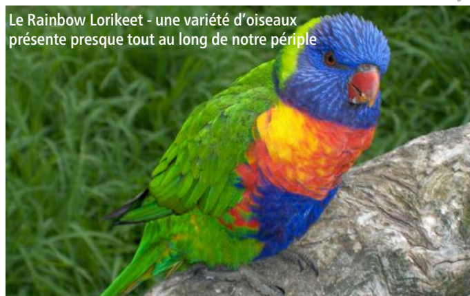
Le Rainbow Lorikeet - une variété d'oiseaux présente presque tout au long de notre périple