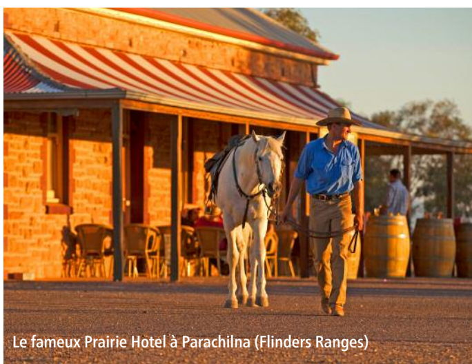
Le fameux Prairie Hotel à Parachilna (Flinders Ranges)