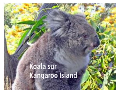
Koala sur Kangaroo Island