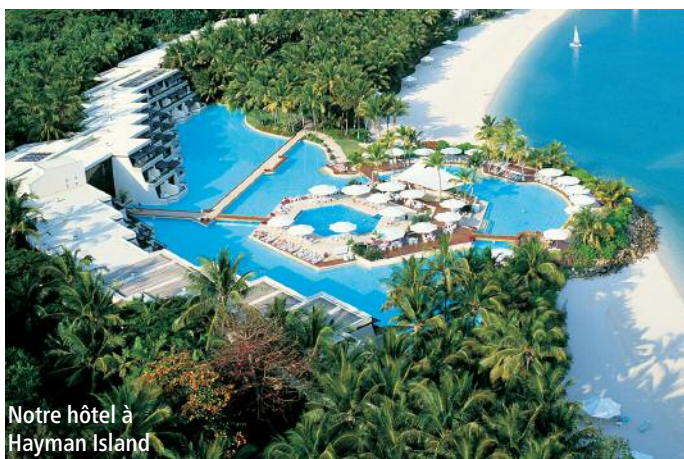
Notre hôtel à Hayman Island