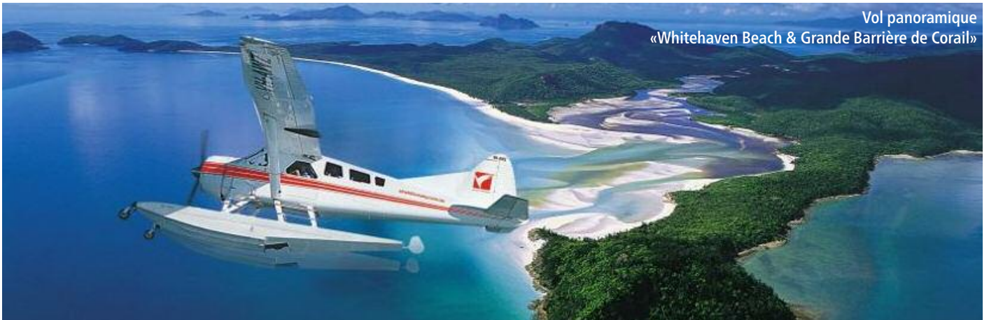
Vol panoramique «Whitehaven Beach & Grande Barrière de Corail»