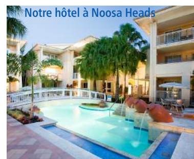
Notre hôtel à Noosa Heads