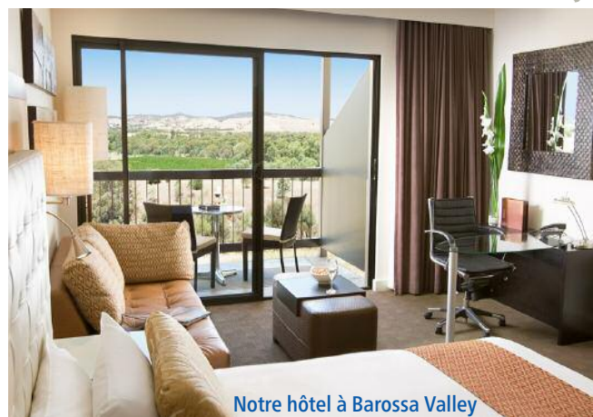
Notre hôtel à Barossa Valley