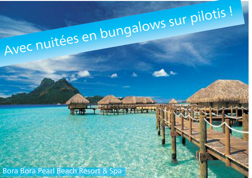
Bora Bora Pearl Beach Resort & Spa

Afin d'apprécier ce paradis, nous vous avons concocté un magnifique programme de 14 nuitées à un prix vraiment avantageux! Prolongez ce programme à votre guise avec l'assistance d'un des spécialistes de Nova Tours officiellement certifiés par l'office du tourisme de Tahiti (certification officielle "Tahiti Tiare").