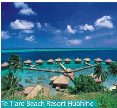
Te Tiare Beach Resort Huahine