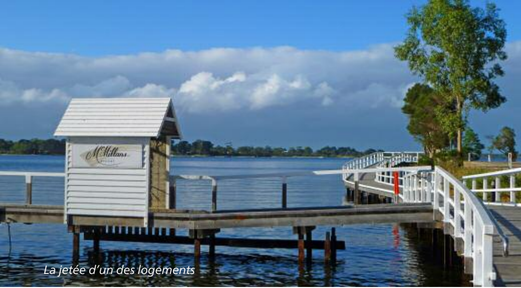
La jetée d'un des logements