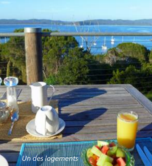
Un des logements