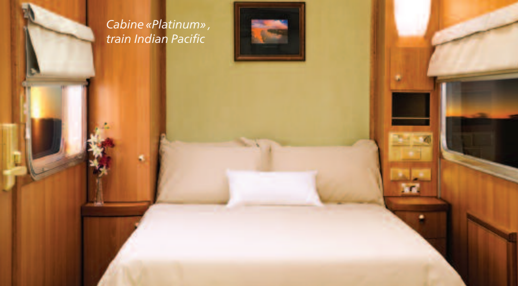
Cabine «Platinum», train Indian Pacific