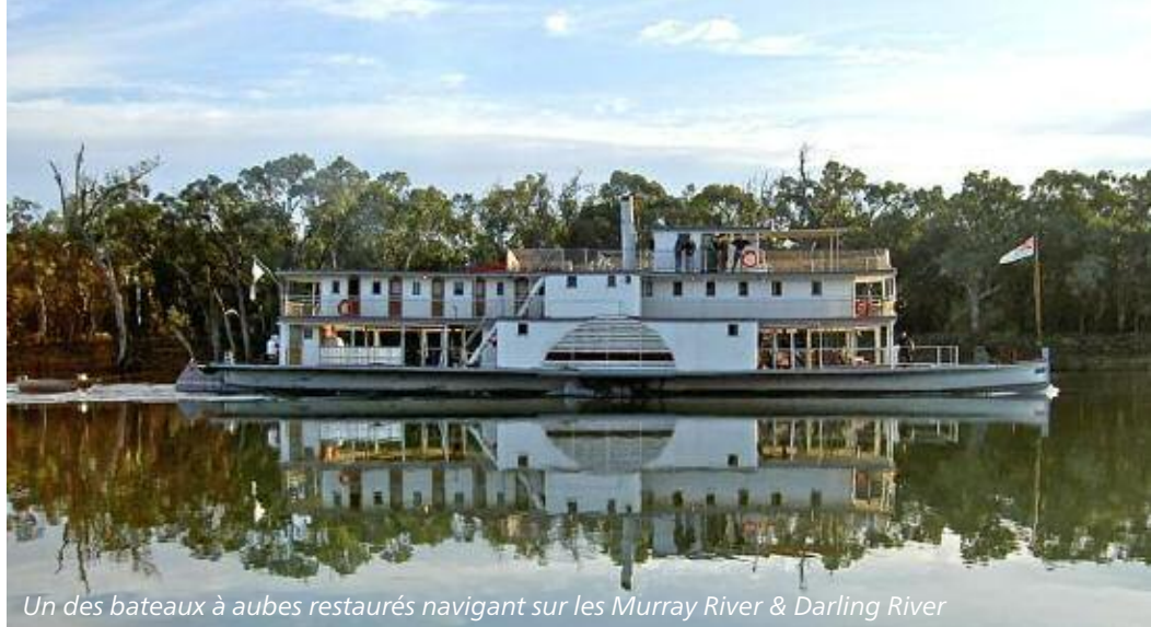
Un des bateaux à aubes restaurés navigant sur les Murray River & Darling River

4ème jour: Sydney - train Indian Pacific Matinée libre. Peu avant 15:00, de Central Station, départ du train Indian Pacific pour Broken Hill. Selon votre choix, vous voyagerez en cabine PLATINUM (compartiment de luxe avec lit double ou 2 lits simples et douche/WC) ou en cabine GOLD (compartiment de 1ère classe avec 2 lits simples superposés et douche/WC). Votre repas du soir vous sera servi dans la voiture-restaurant «Queen Adelaide». Vous aurez accès à la voiture-salon/bar «Outback Explorer Lounge».