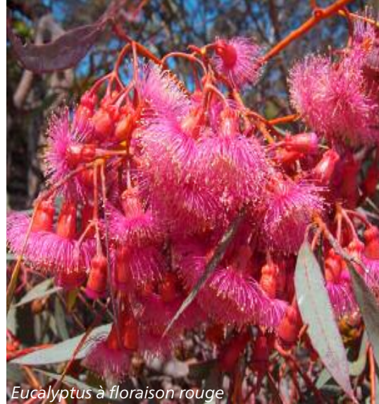
Eucalyptus à floraison rouge