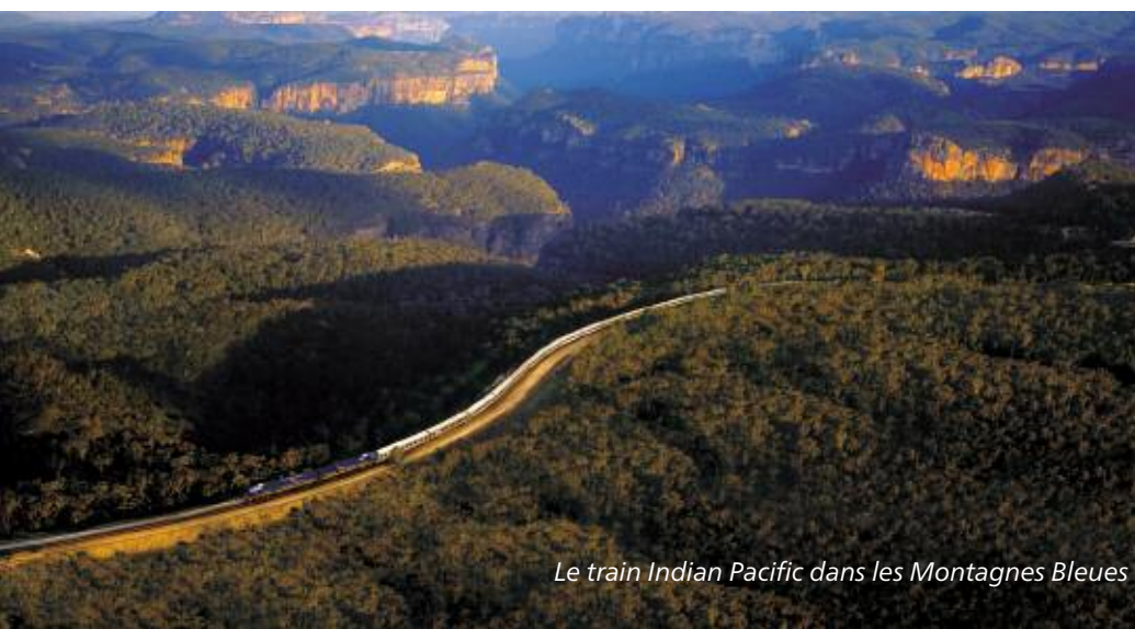
Le train Indian Pacific dans les Montagnes Bleues

Type d'expériences: assemblage d'excursions en petits groupes et de séjours en individuel.