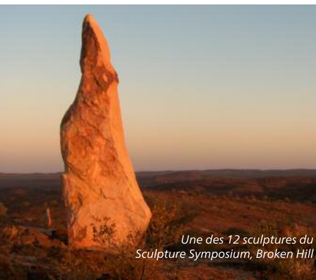
Une des 12 sculptures du Sculpture Symposium, Broken Hill

NB: si ce forfait vous intéresse mais dans une catégorie de confort plus simple, sachez que nous proposons aussi un autre forfait touchant Broken Hill. Il comprend 3 nuitées à Sydney en hôtel ***(*), la journée de visites en français à Sydney avec repas tel que décrit dans le forfait ci-dessus, le trajet en train INDIAN PACIFIC de Sydney à Broken Hill avec nuitée à bord en couchettes RED KANGAROO (2ème classe), 1 tour en petit groupe «Broken Hill & Silverton» avec lunch, 1 nuitée à Broken Hill en motel, un circuit de 2 jours en petit groupe aux champs d'opales de White Cliffs et au parc national de Paroo-Darling avec nuitée en hôtel troglodyte et pension complète ainsi qu'une dernière nuitée à Broken Hill. Fin du circuit à Broken Hill, vol séparé pour Adelaide/Sydney/etc. Prix indicatif jusqu'au 31.03.12: A$ 1'988.00 p.p. en chambre double. Deux départs par semaine, détails sur dem. En option: extension d'une nuitée à Broken Hill avec visite du parc national de Kinchega et des immenses lacs Menindee. Détails sur demande.