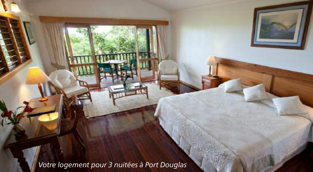
Votre logement pour 3 nuitées à Port Douglas