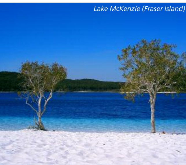
Lake McKenzie (Fraser Island)

Vous quitterez les plateaux pour atteindre la mer de Corail. Vous séjournerez pour 3 nuitées dans un établissement très confortable de 85 chambres, situé en pleine nature, bordant deux plages (sans route à traverser), à 10mn de route de la bourgade côtière de Port Douglas. Niché au milieu de 85ha de jardins naturels, de forêts et de plantations de noix de