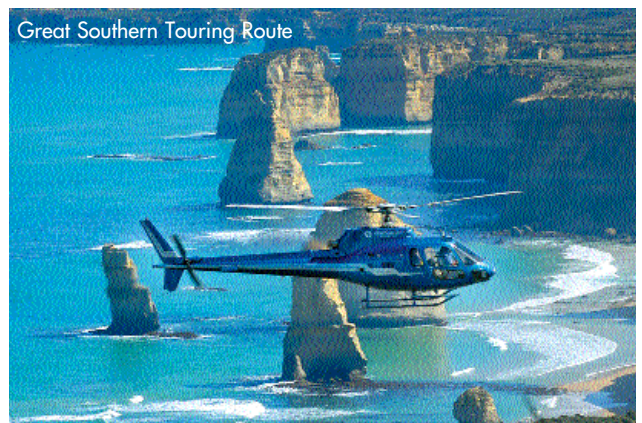
Great Southern Touring Route