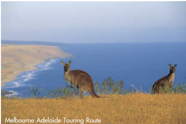
Melbourne Adelaide Touring Route