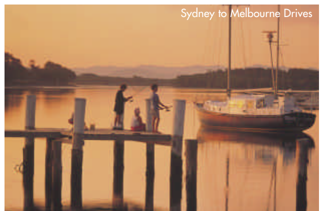
Sydney to Melbourne Drives