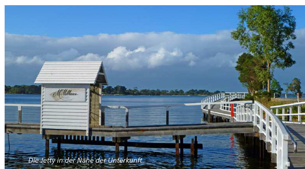
Die Jetty in der Nähe der Unterkunft